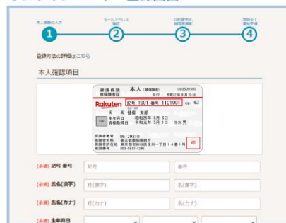
オンラインユーザー登録画面

URL https://pepup.life/users/ekyc/AQW4A8nh/sign_up